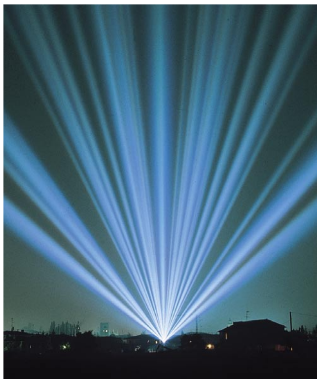
Faisceaux visibles à 8 Km.